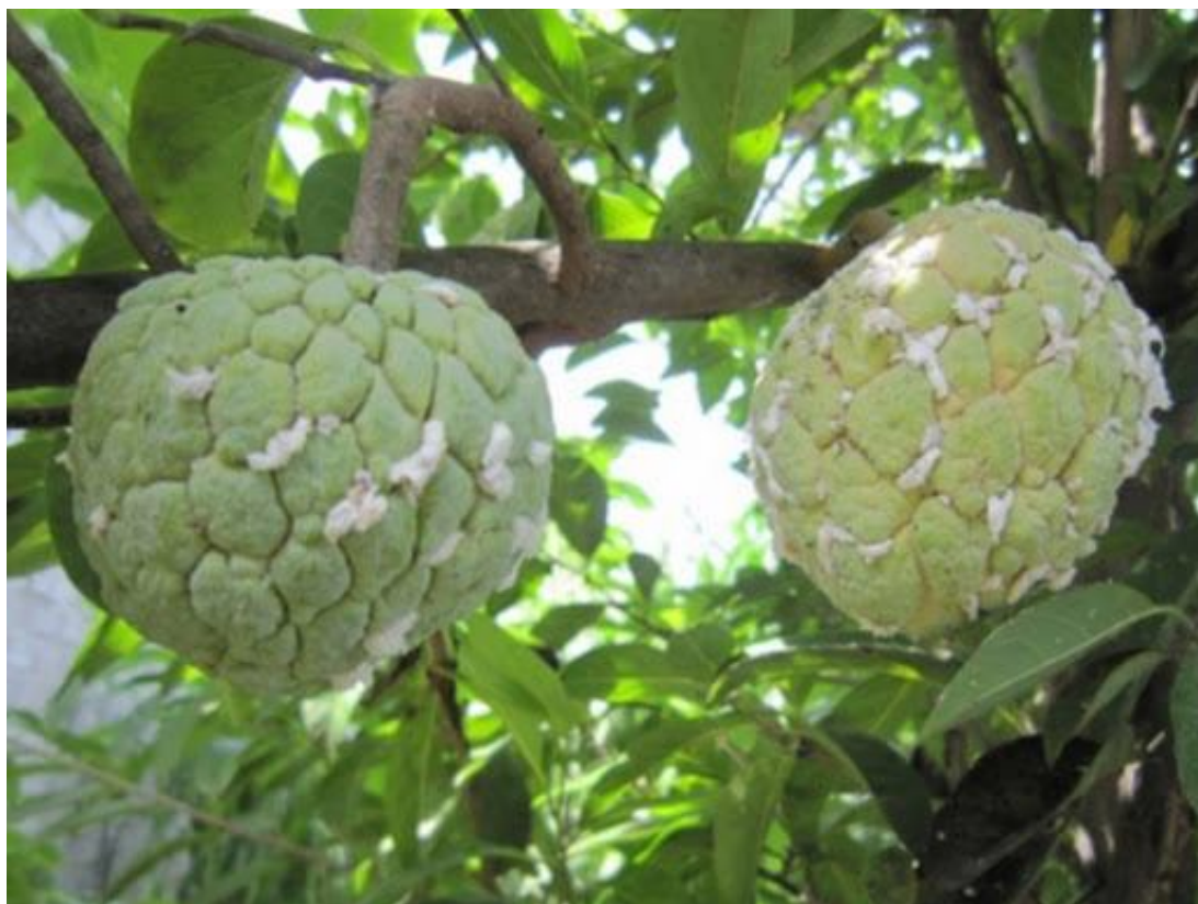
Sâu hại trên măng cầu