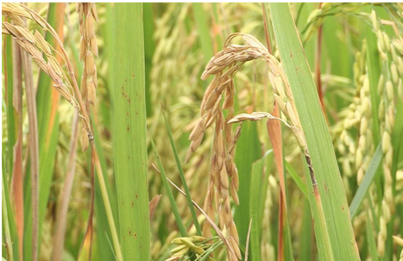
Bông lúa bị lép lửng do đạo ôn cổ bông gây hại

Ngoài ra, nấm bệnh đạo ôn còn tấn công ở những bộ phận khác như nhánh gié, cuống hạt, đốt thân gây ảnh hưởng nghiêm trọng đến sự phát triển của cây lúa.