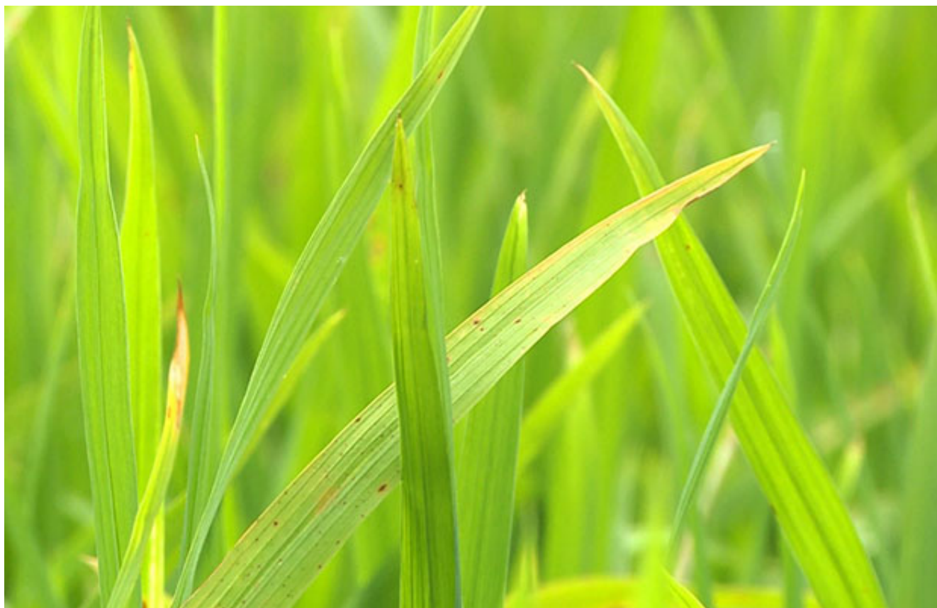
Vết chấm kim trên lá lúa – biểu hiện ban đầu của bệnh đạo ôn

Đối với cổ bông, cổ gié thì vết bệnh ban đầu là một chấm nhỏ màu đen tại đoạn cổ giáp với tai lá và lớn dần về sau làm cổ bông khô héo. Vì cổ bông khô héo nên quá trình vận chuyển chất dinh dưỡng từ lá vào hạt bị gián đoạn, từ đó bông lúa có thể bị trắng hoặc lép lửng, mất năng suất khi thu hoạch.