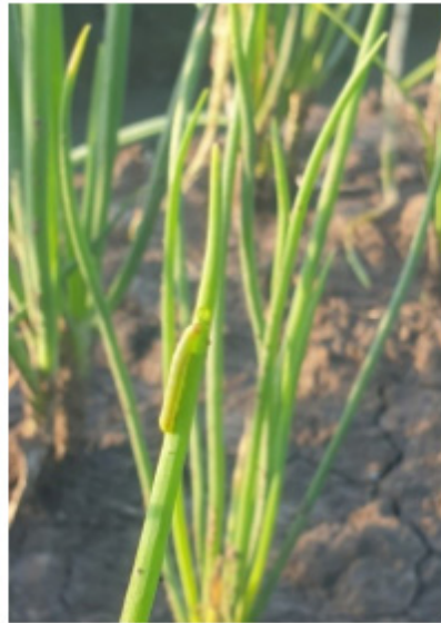
Sâu hại trong và ngoài lá hành