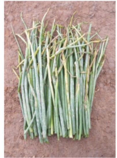
Lá hành bị sâu gây hại