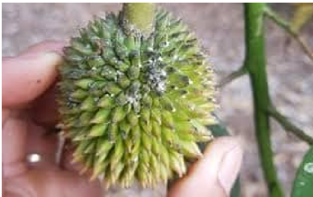
Rệp sáp gây hại trên trái sầu riêng non

Trên trái non: thì làm teo tóp cuống trái, trái bị gai to – gai nhỏ sẽ không đều. Trái bị méo mó, vàng gai, không lớn và dễ bị rụng.