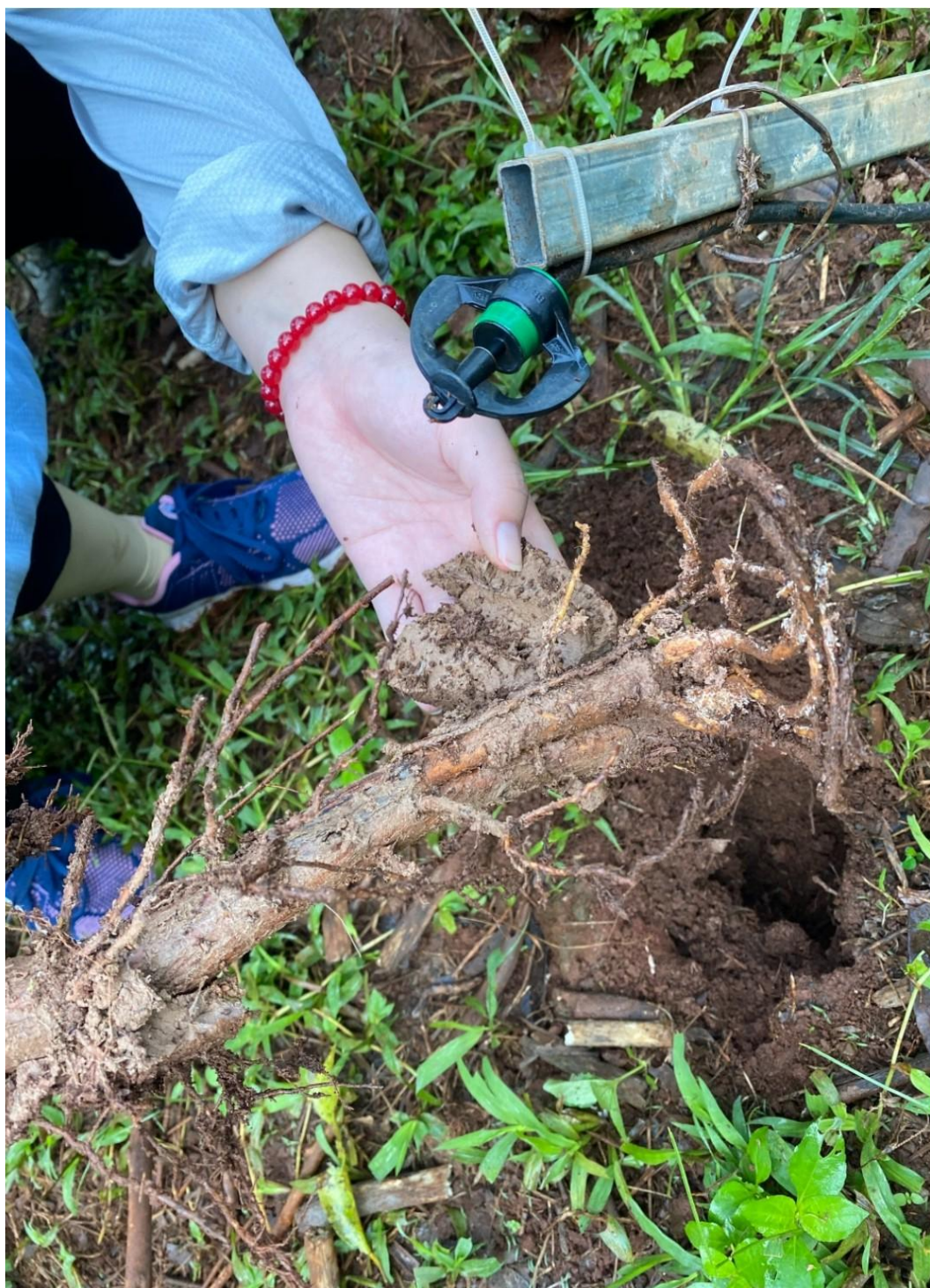
Cây bị rệp sáp hại rễ