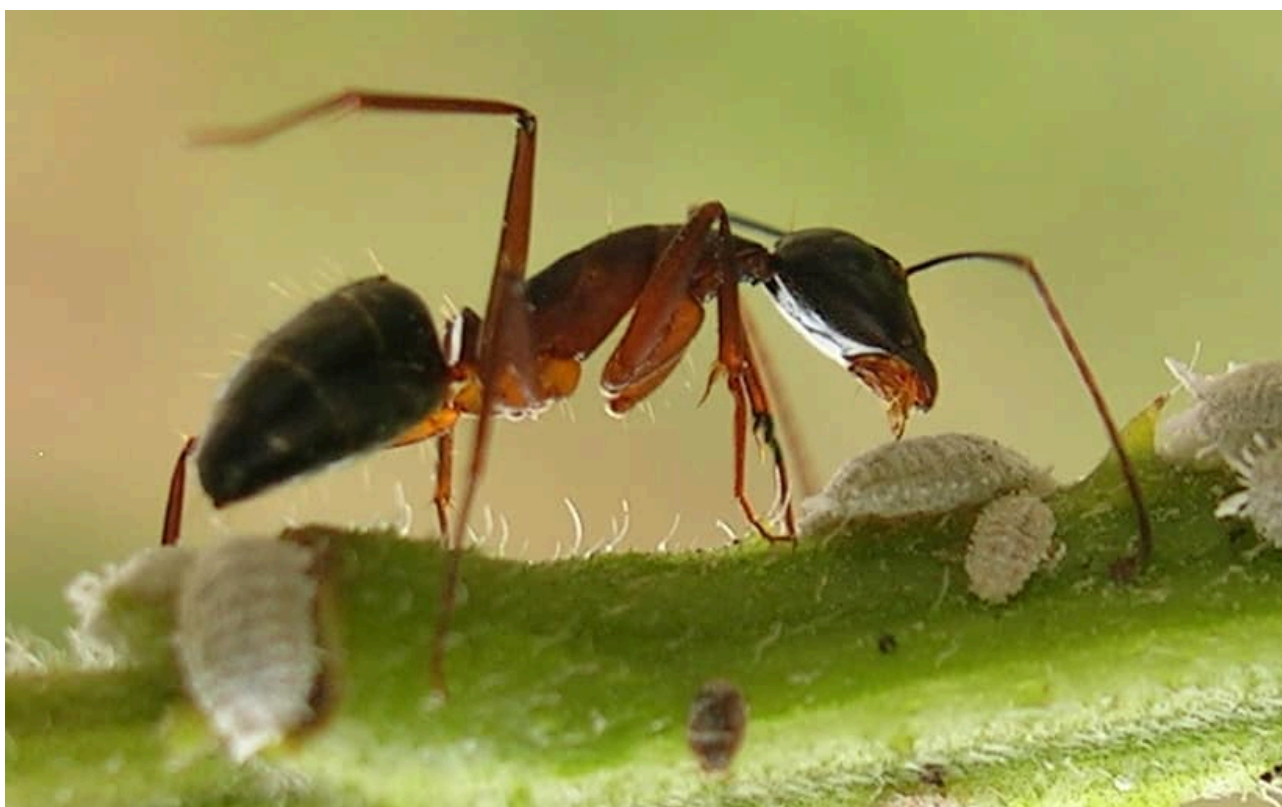
Diệt đồng thời cả rệp và kiến