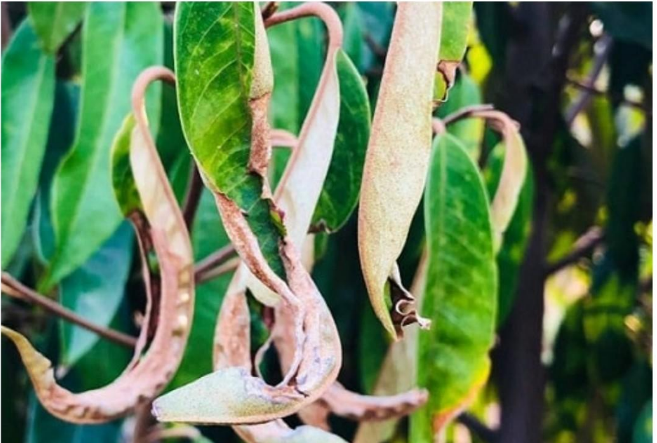
Rầy nhậy trên cây sầu riêng - Lá sầu riêng bị rầy nhậy chích hút làm mép lá cháy xoắn