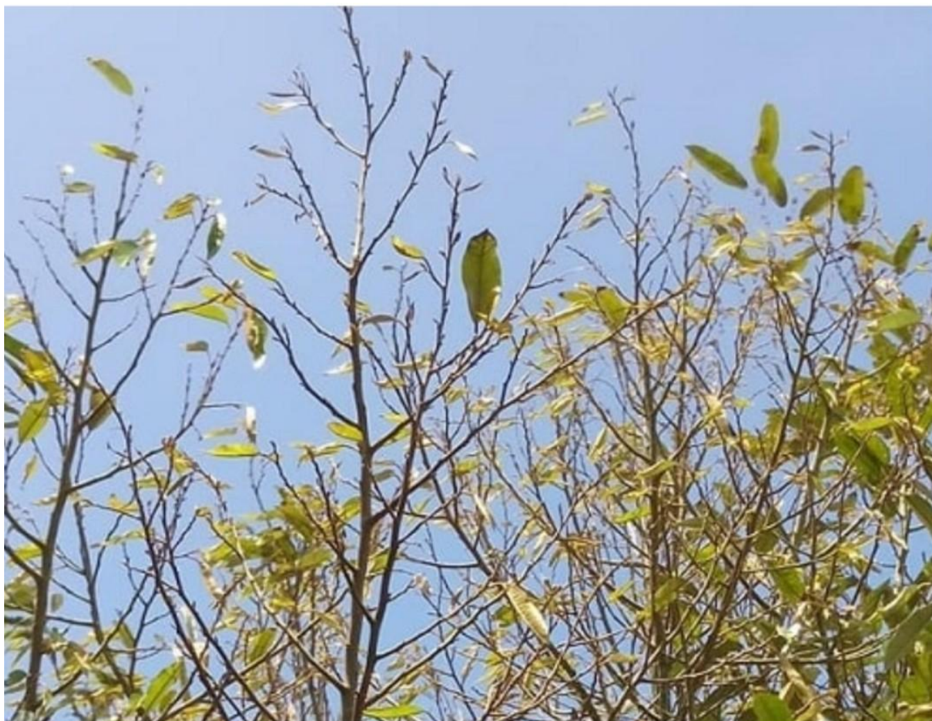
Ngon cây rụng lá trơ trọi