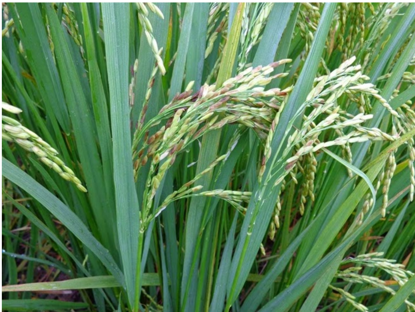
Bệnh lem lép hạt lúa