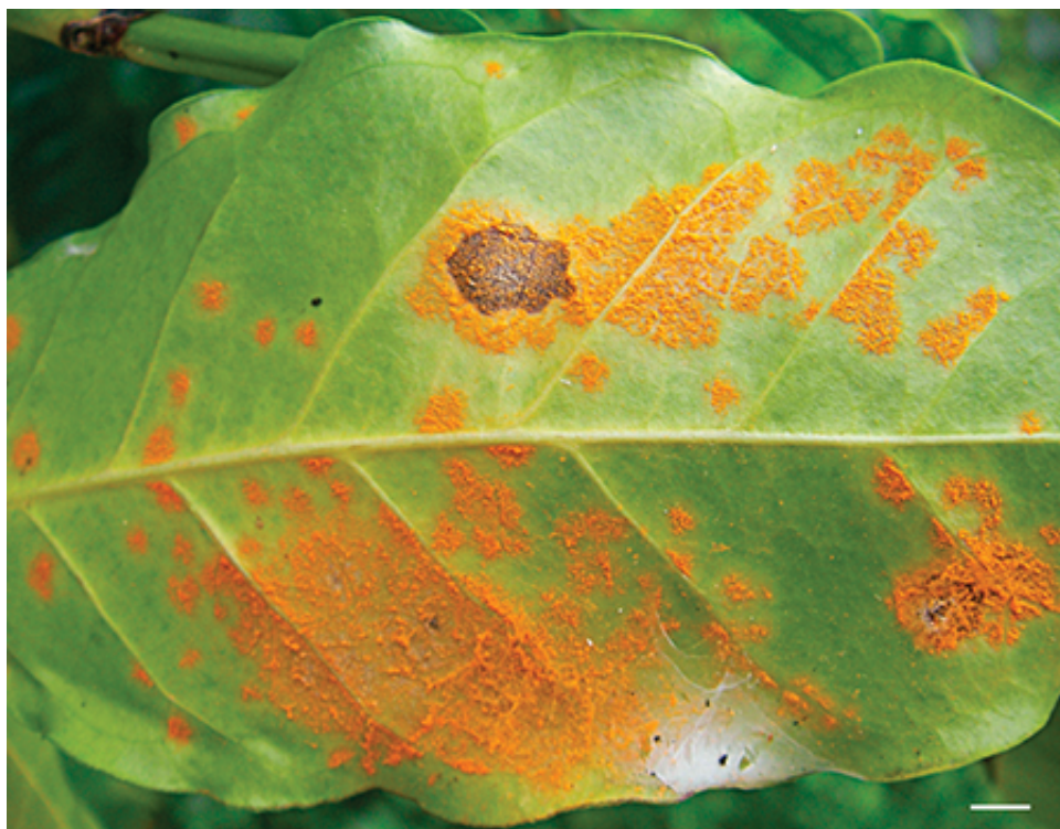
Triệu chứng bệnh gỉ sắt cà phê ở mặt dưới lá

- Ở mặt dưới của lá khi bị nhiễm bệnh gỉ sắt thì lá cà phê sẽ xuất hiện những chấm nhỏ màu vàng nhạt. Sau một thời gian những chấm này sẽ lớn dần và phía trên những chấm nhỏ xuất hiện lớp bột màu cam. Đây chính là bào tử của nấm gỉ sắt. Sau một thời gian phát triển các bào tử này sẽ ăn rộng ra bề mặt lá và chuyển dần từ màu cam sang màu trắng. Những bào tử này dần biến mất và để lại trên lá những vết bệnh màu nâu như bị cháy, có quầng vàng bao quanh.