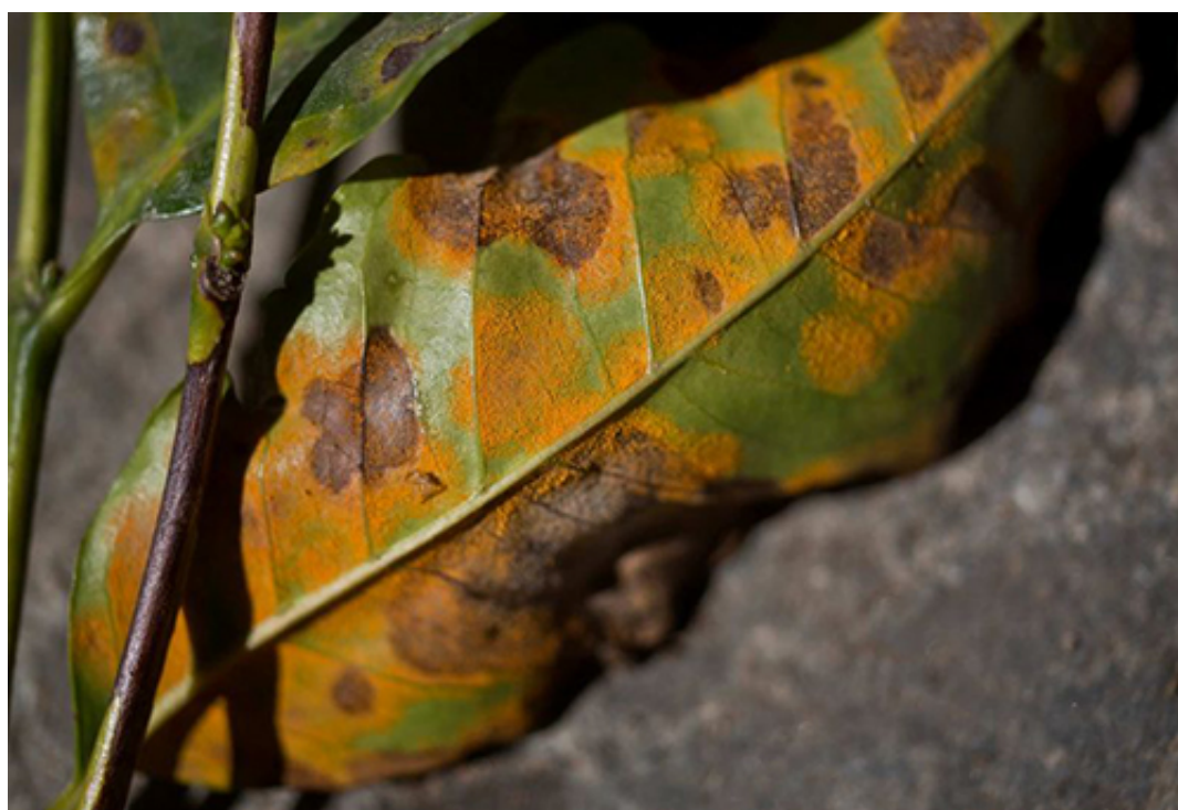
Triệu chứng bệnh gỉ sắt trên lá cà phê

- Ở mặt dưới của lá khi bị nhiễm bệnh gỉ sắt thì lá cà phê sẽ xuất hiện những chấm nhỏ màu vàng nhạt. Sau một thời gian những chấm này sẽ lớn dần và phía trên những chấm nhỏ xuất hiện lớp bột màu cam. Đây chính là bào tử của nấm gỉ sắt. Sau một thời gian phát triển các bào tử này sẽ ăn rộng ra bề mặt lá và chuyển dần từ màu cam sang màu trắng. Những bào tử này dần biến mất và để lại trên lá những vết bệnh màu nâu như bị cháy, có quầng vàng bao quanh.