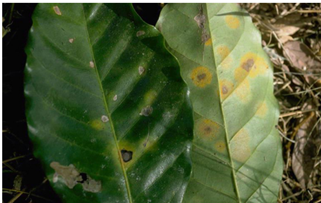
Triệu chứng bệnh gỉ sắt cà phê

- Vết bệnh thường xuất hiện trên lá non và lá trưởng thành. Ban đầu trên phiến lá thường xuất hiện những điểm màu trắng đục hay những chấm vàng nhạt có kích thước nhỏ từ 0,2 – 0,5 mm. Sau đó vết bệnh lớn dần tới 5 – 8mm.